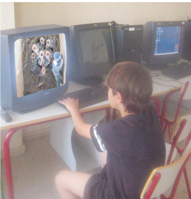
Mediante la cámara se puede observar todo el proceso de cría de las aves sin molestarlas.