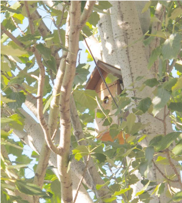
Caja nido ya instalada en un arbol