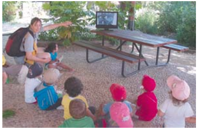
Este recurso tiene un especial interés para los niños, por su espectacularidad y ofrece numerosas aplicaciones en educación ambiental.